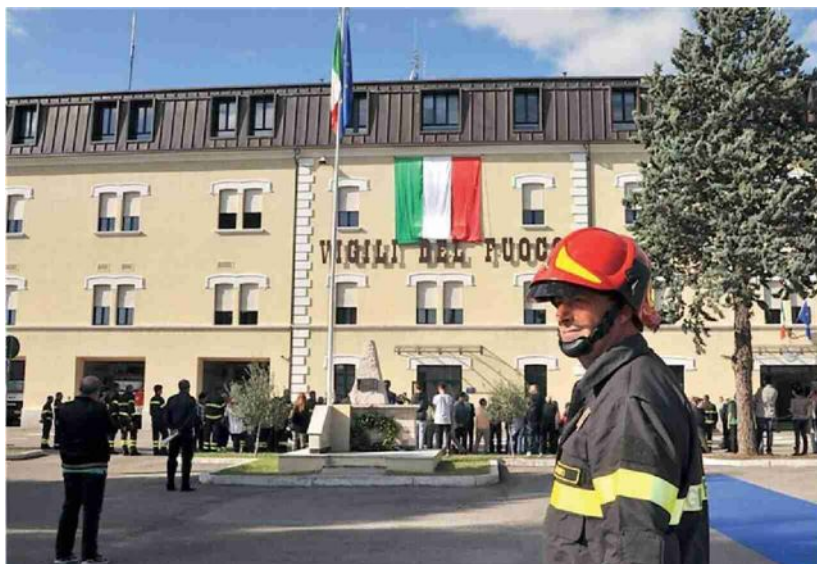
La sede del comando provinciale dei vigili del fuoco nella ex caserma degli alpini Grue