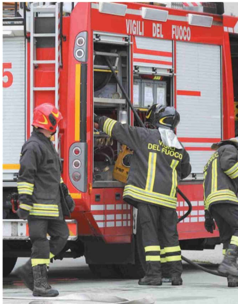
Pompieri Vigili del fuoco impegnati in un intervento

1 Sede operativa Anche la caserma di Viterbo è rimasta senza gas ed è stato necessario chiedere il distacco del personale presso altre strutture