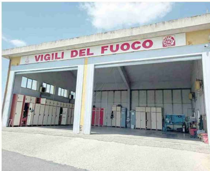
VIGILI DEL FUOCO La caserma di Civita Castellana