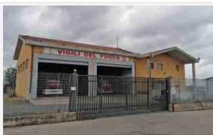
La sede dei vigili del fuoco a Civita Castellana

Civita Castellana - Vigili del fuoco senza gas a causa di bollette non pagate.