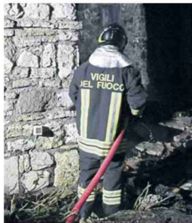
VIGILI DEL FUOCO In azione