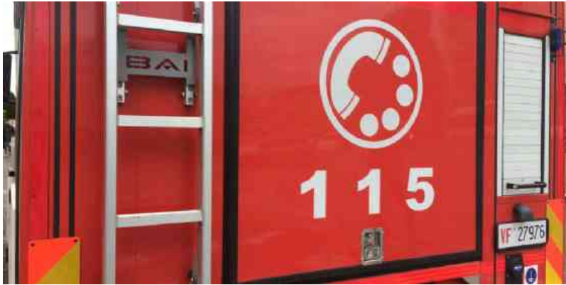
Vigili del Fuoco, troppo pochi i 'rinforzi' destinati al Fvg (DIARIO)