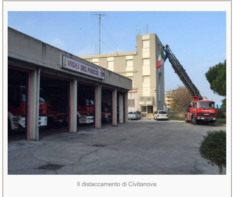
Il distaccamento di Civitanova