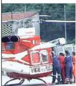
L'elisoccorso svolto dai vigili del fuoco

Commenta soddisfatto Antonio Brizzi, segretario generale del Conapo (sindacato autonomo dei vigili del fuoco). «Sono reduce da una riunione al Viminale, nel corso della quale il sottosegretario Gianpiero Bocci ha spiegato che, in accoglimento delle nostre richieste, è imminente